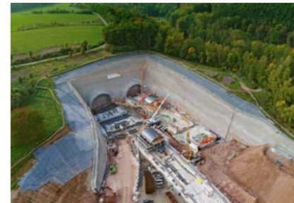
A 44, Tunnel Trimberg (Hessen)