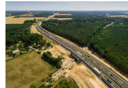
A 10, achtstreifiger Ausbau (Brandenburg)