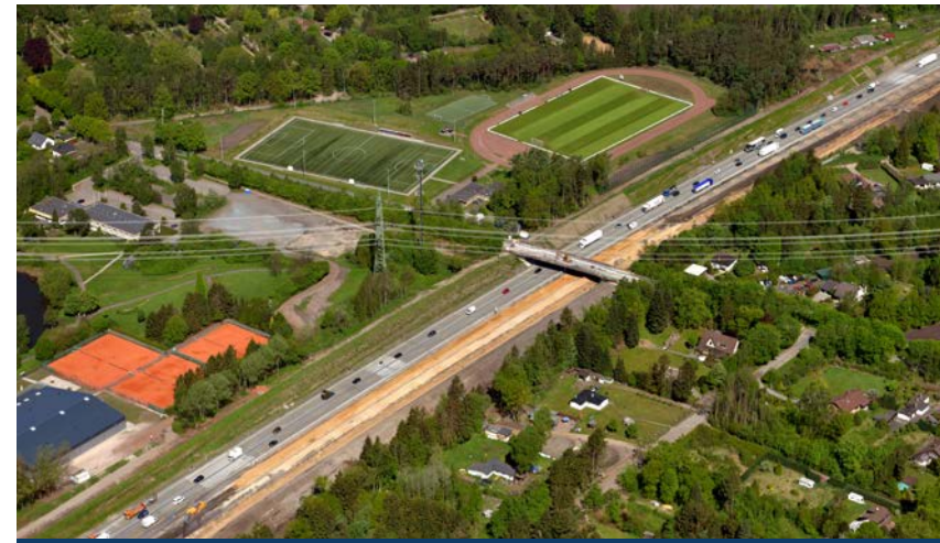
A 7, acht- bzw. sechsstreifiger Ausbau (Hamburg und Schleswig-Holstein)

Hauptsitz der DEGES ist Berlin. Zweigstellen gibt es in Hamburg, Bremen, Düsseldorf und Frankfurt am Main.